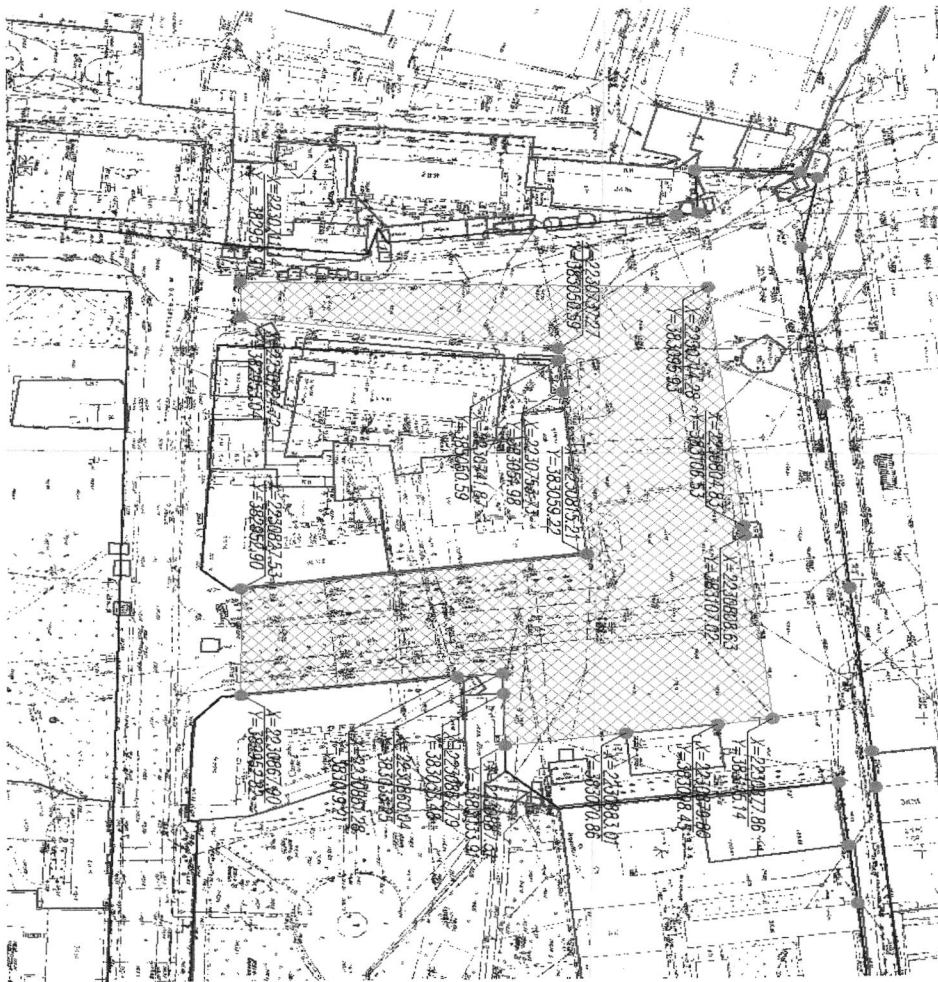
Схема участка автомобильной дороги общего пользования местного значения города Пензы для проектирования и создания в его границах платной парковки на Привокзальной площади Пенза-1 от перекрестков с улицей Октябрьская

Первый заместитель главы администрации города