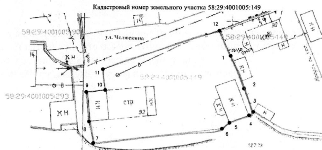
Схема границ земельного участка, расположенного по адресу: г. Пенза, ул. Челюскина, 92