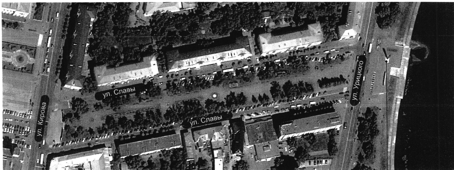
Монумент Славы Росток

○ - предполагаемое место для размещения скульптуры на ул. Славы