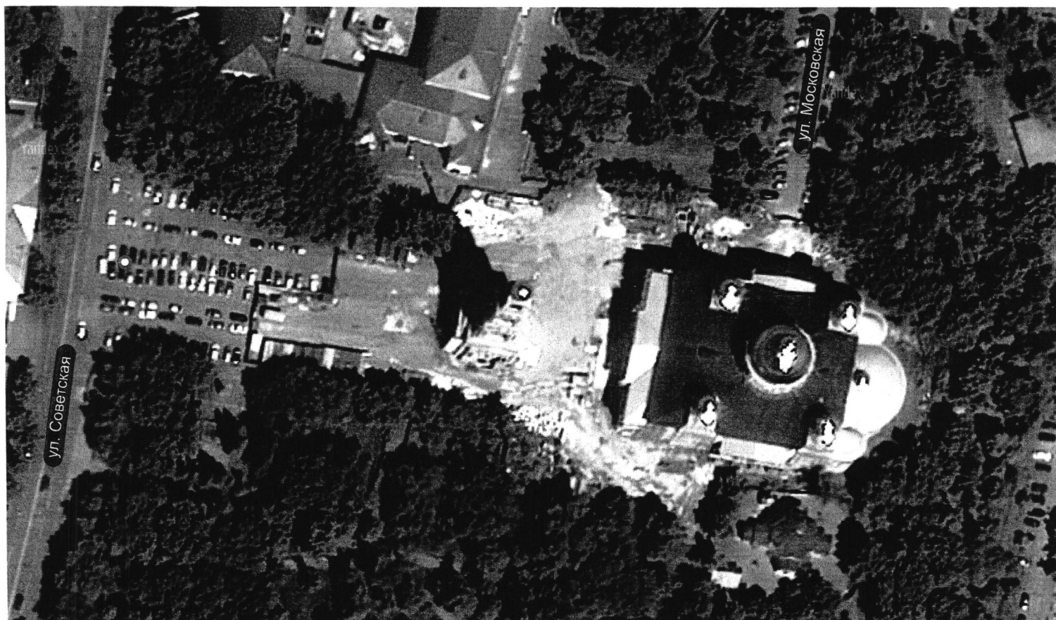
○ - предполагаемое место для размещения скульптуры на Советской площади

Приложение 3 к Положению о городском открытом конкурсе на разработку проекта декоративной скульптуры на тему «Материнство» для городской среды в городе Пензе