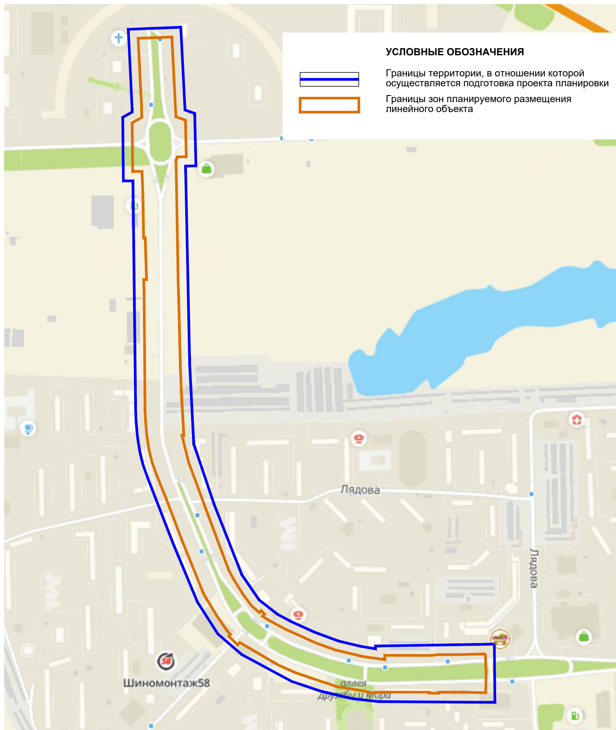
СХЕМА РАСПОЛОЖЕНИЯ ЭЛЕМЕНТОВ ПЛАНИРОВОЧНОЙ СТРУКТУРЫ